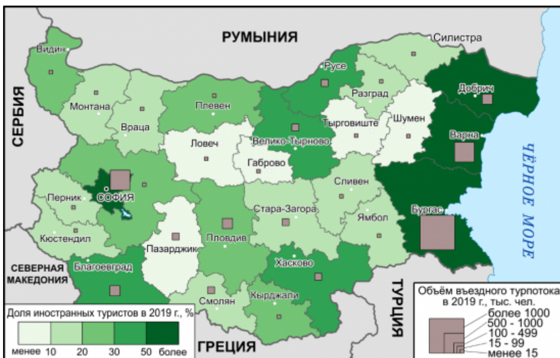
Рис. 3. Объём въездного турпотока и доля иностранных туристов по областям Болгарии в 2021 г. Fig. 3. The volume of inbound tourist flow and the share of foreign tourists by regions of Bulgaria in 2021

26 В причерноморских областях доля иностранных туристов, как и в 2019 г., сохранилась на очень высоком уровне, за исключением Бургасской области (ранее лидировавшей по объёму иностранного турпотока), в которой ярко проявился эффект замещения внутренними туристами. В столице страны Софии также сохранился высокий удельный вес въездного турпотока.