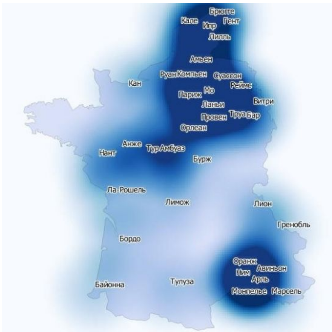
Рис. 1. Процедура выявления центрo-периферийной структуры с помощью инструмента «теплокарта» в QGIS на примере Французского королевства накануне Столетней войны (составлено автором)