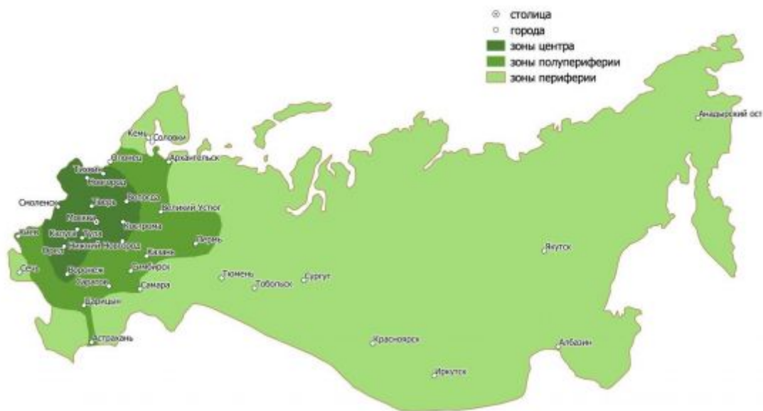
Рис. 4. Центрo-периферийная структура геополитической системы Московского царства (составлено автором)