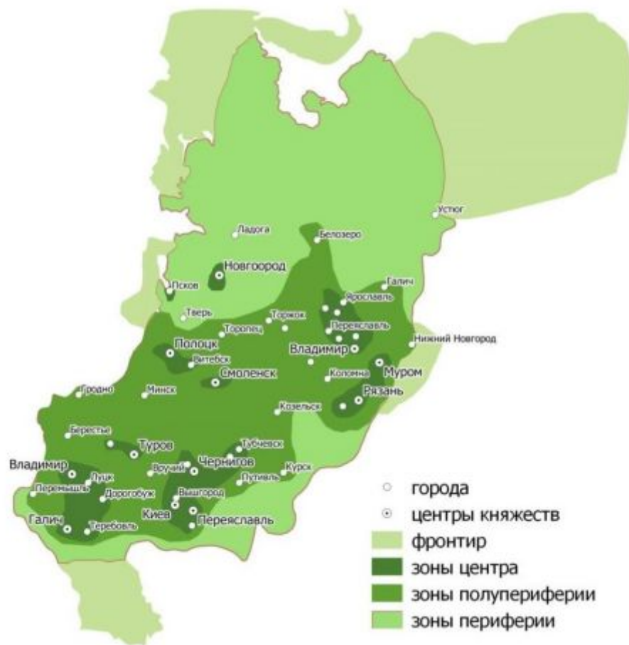
Рис. 3. Центрo-периферийная структура геополитической системы Киевской Руси (составлено автором)