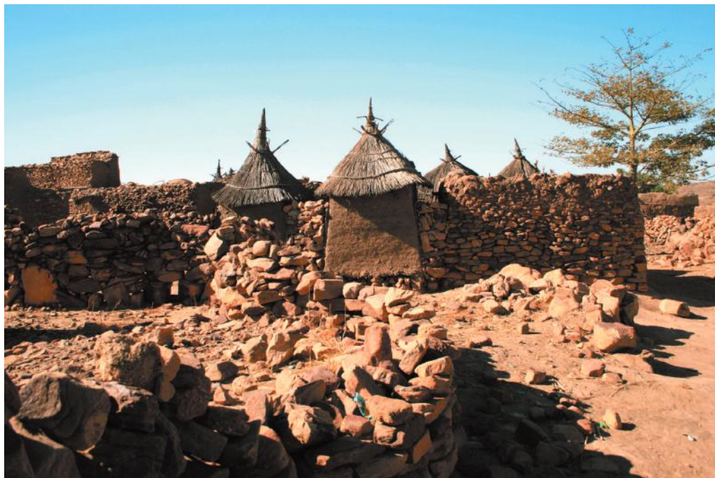
Илл. 4. Деревня Сонингхе.