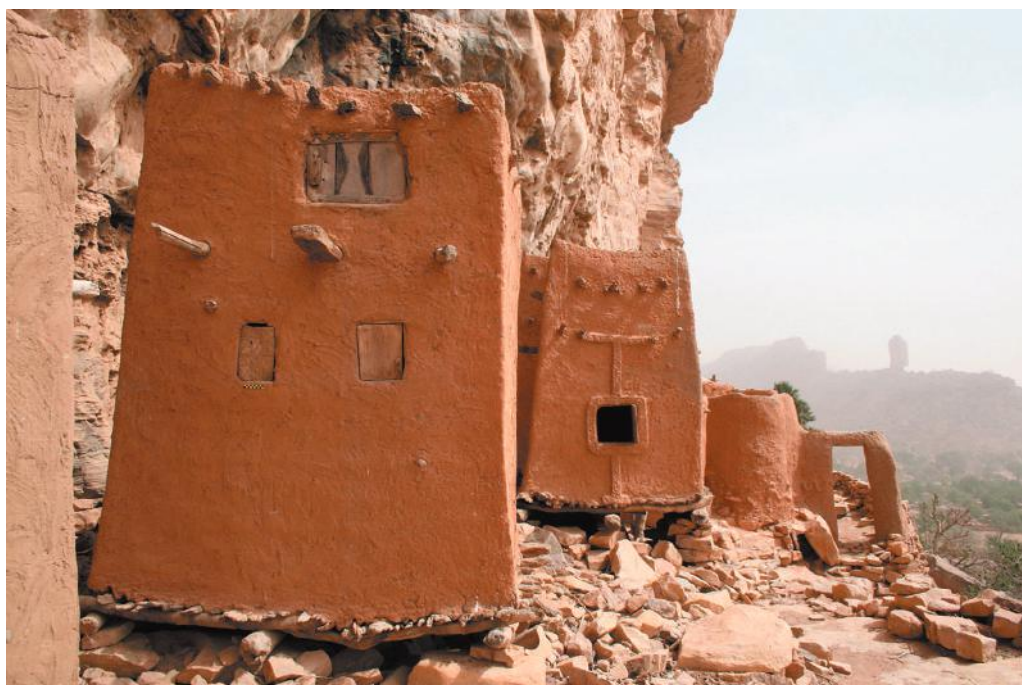
Илл. 2. Старый, теперь покинутый квартал Огоденгу д. Энде.