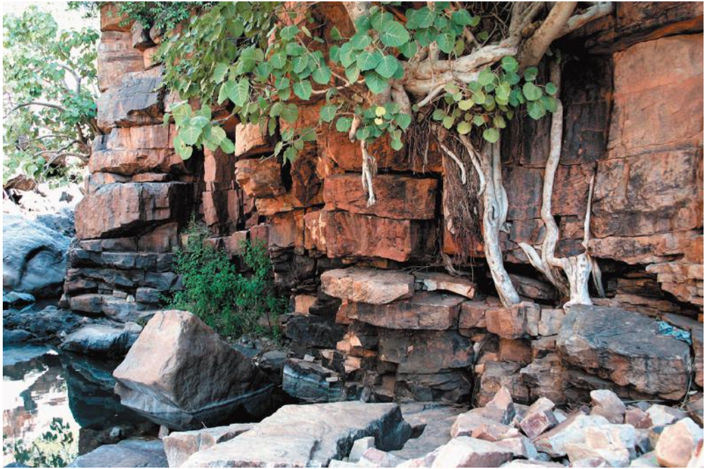
Илл. 6. Непересыхающий источник в ущелье Йороборо.