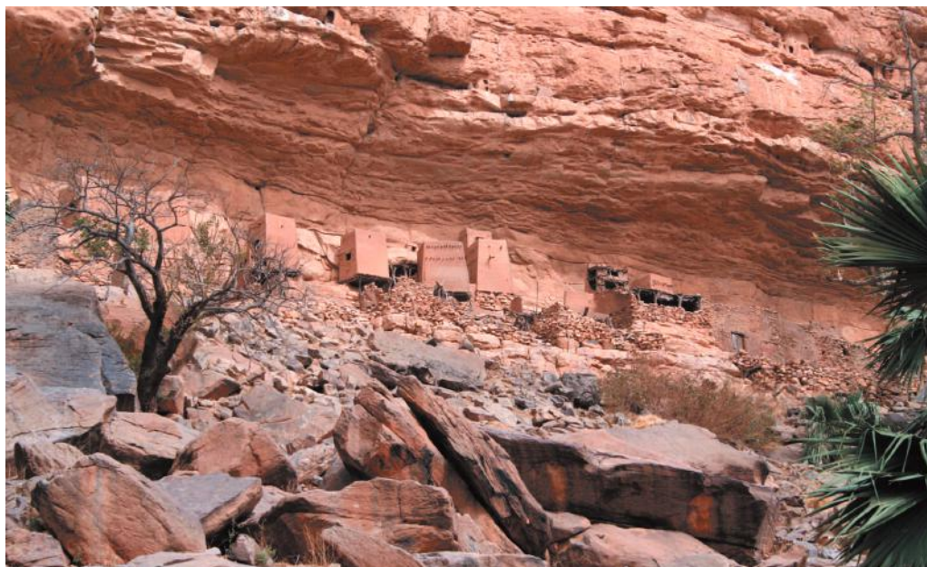
Илл. 1. Старый, теперь покинутый квартал Энде-Во д. Энде.