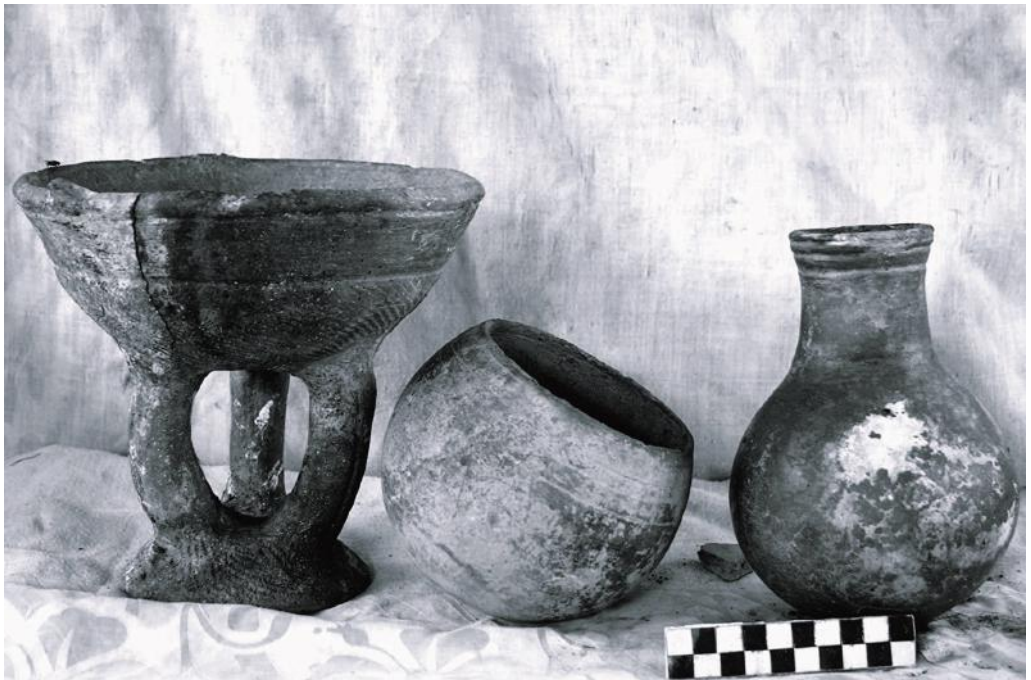
Илл. 7. Керамика теллем X–XVI вв.